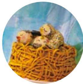
森の中のいろんなともだち